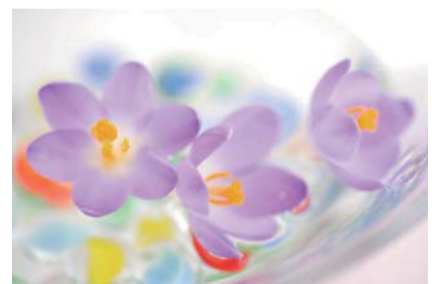
イメージ茶話会会員登録