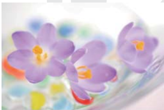
イマージュ茶話会 会員登録