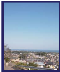
☆サロンからの景色です。

茨城県日立市滑川町3-17-8 Tel: 0294-24-5864 【完全予約制】 営業時間: 9:00 ~ 20:00 (受付18:00) 定休日: 日曜日