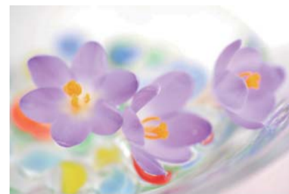
イマージュ茶話会会員登録